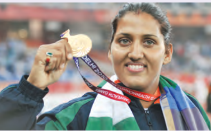
Krishna Poonia Padam Shri Awardee